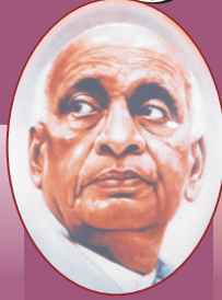
Chancellor Shri Om Prakash Kohli